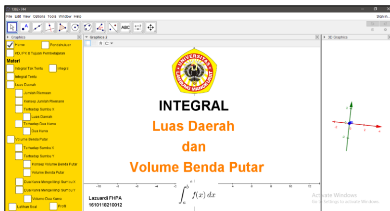
Gambar 1 Hasil Tampilan Depan Media Matematika Berbasis Geogebra

Pembuatan media ini dimulai dari menentukan mengenai materi apa yang sekiranya cocok dan dapat terbantuan dengan adanya media ini dimana materi yang dipilih adalah integral. Pada materi ini berisikan teks materi, grafik fungsi dalam bentuk 2D dan 3D, serta diberikan latihan soal dan simulasi sehingga media yang dikembangkan bersifat interaktif pada penggunaannya. Pada proses ini, hasil rancangan konsep yang telah ada diolah menjadi media pembelajaran yang berisikan menu dan tampilan yang dinamis serta menarik ketika digunakan. Hasil tampilan dari media yang dihasilkan ditampilkan pada Gambar 1.