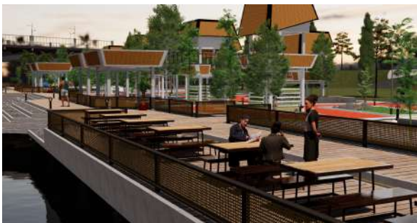
Gambar 8 : Perspektif Eksterior Siring