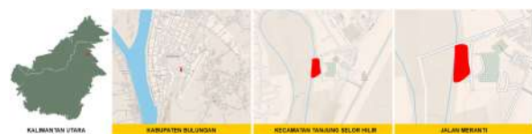
Gambar 3 : Lokasi Rancangan

Provinsi Kalimantan Utara mempunyai luas wilayah 13.182 kilometer persegi dan jumlah penduduk 701.814 jiwa (hasil Sensus