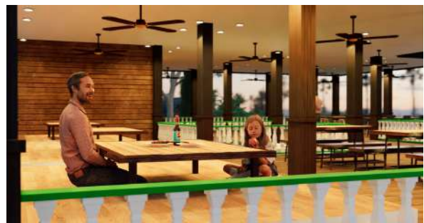
Gambar 12 : Perspektif interior rumah makan