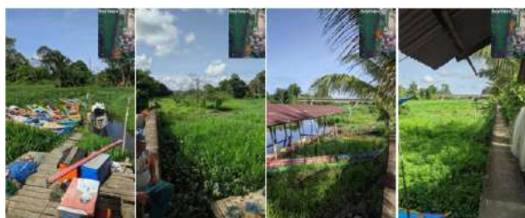
Gambar 1 : Kondisi Eksisting

Provinsi Kalimantan Utara mempunyai luas wilayah 13.182 kilometer persegi dan jumlah penduduk 701.814 jiwa (hasil Sensus Indonesia 2020). Kabupaten Bulungan mempunyai luas wilayah 13.182 kilometer persegi dan jumlah penduduk 151.844 jiwa (hasil Sensus Indonesia 2020). Sebagian Kabupaten Bulungan masuk dalam daftar calon ibu kota Kalimantan Utara. Struktur demografi bila jumlah penduduk usia produktif yang sangat besar dapat menjadi salah satu modal pembangunan. Hasil SP2020 menunjukkan mayoritas penduduk Kalimantan Utara didominasi oleh Generasi Z dan Milenial. Generasi Z berjumlah 30,53% dari total penduduk Kalimantan Utara (701.814 jiwa), dan generasi milenial berjumlah 27,68% dari total penduduk Kalimantan Utara. Kedua generasi tersebut merupakan generasi usia produktif yang dapat menjadi peluang percepatan pertumbuhan ekonomi.