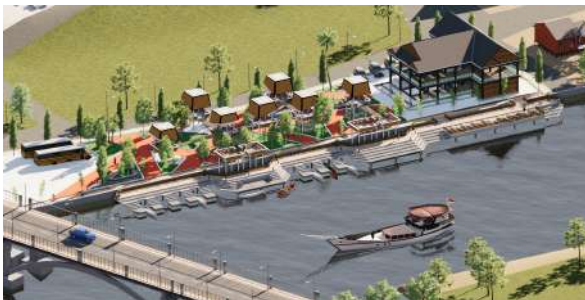
Gambar 7 : Perspektif Eksterior Siang Drone