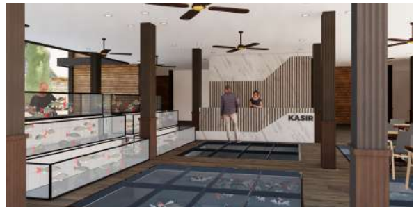
Gambar 11 : Perspektif interior rumah makan