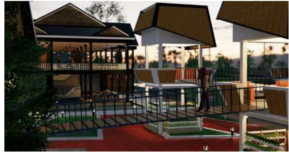
Gambar 9 : Perspektif Eksterior Malam