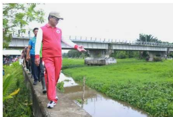
Gambar 2 : Normalisasi Aliran Sungai Buaya 2019 Sumber : News Kaltara

Dari permasalahan tumbuhan liar membuat para nelayan di Jl. Meranti yang sering menggunakan alternatif Sungai Buaya untuk berlalu lintas ketinting, dengan adanya peran pemerintah provinsi 2019 menggunakan fasilitas ketinting saja untuk partisipasi dengan bersama masyarakat untuk membersihkan tumbuhan eceng gondok, meskipun eceng gondok sudah dibersihkan pada saat 2019 dengan cepatnya 2022 kembali menutupi Sungai Buaya. Kurangnya partisipasi untuk membersihkan dengan populasi eceng gondok yang sangat banyak sehingga masyarakat kewalahan atas permasalahan ini.