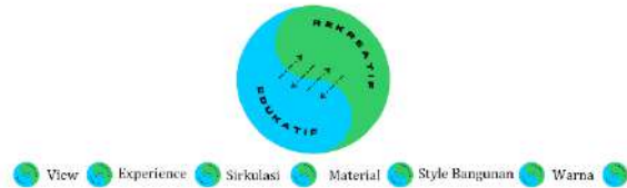
Gambar 5 : Kondisi Eksisting Sumber : Penulis

Penerapan konsep Edukatif Kreatif bertujuan untuk menyegarkan pikiran dan tubuh secara menggembirakan dan menyegarkan melalui beberapa rekreasi, hobi, berjalan-jalan atau melakukan aktivitas yang menyenangkan. Tujuannya adalah memulihkan raga, jiwa, pikiran dan kreativitas yang hilang oleh individu atau kelompok akibat kehidupan sehari-hari. Lebih dari sekedar rekreasi dan hiburan, kawasan ini bertujuan untuk merancang bangunan yang memberikan fasilitas pembelajaran dan pemahaman bagi manusia/pengunjung, sehingga dapat menambah wawasan dan pengetahuan pendidikan melalui arsitektur, melalui observasi dan analisis visual, sehingga pengguna dapat memperoleh berbagai pengalaman. Kesimpulannya: