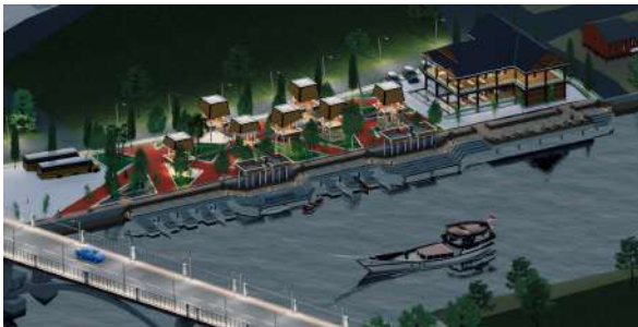
Gambar 6 : Perspektif Eksterior Malam Drone