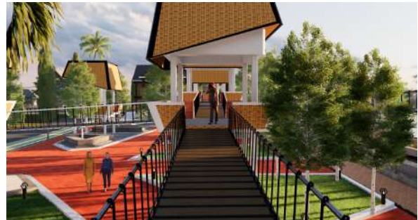
Gambar 10 : Perspektif Eksterior Siang