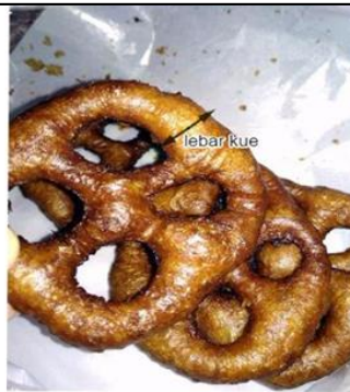
Gambar 8 Kue cincin

Adapun penilaian butir soal tersebut, menggunakan pedoman penskoran pedoman berpikir kritis, karena butir soal digunakan untuk mengukur kemampuan berpikir kritis, di mana penskorannya sama dengan butir soal nomor 2 pada pembahasan soal sesudah dikonsultasikan, yaitu indikator klarifikasi berupa menuliskan diketahui dan ditanyakan diberi skor maksimal 4, indikator assesmen dan strategi berupa menuliskan formula atau rumus dan menentukan langkah-langkah penyelesaian yang tepat diberi skor maksimal 12, dan indikator inferensi atau menyimpulkan diberi skor maksimal 4.