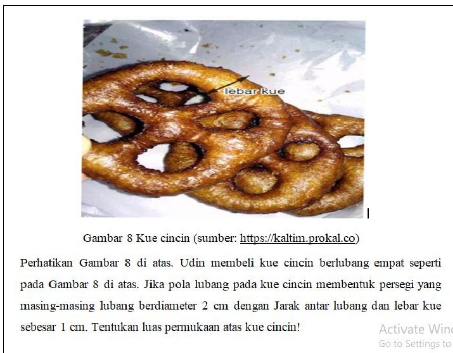
Gambar 5 Rumusan Soal nomor 5 paket C sesudah di revisi

Pada soal nomor 5 paket C masukkan validator terletak pada konteks soal, yaitu rumusan soal tidak kontekstual, di mana soal ditujukan untuk mencari luas kue yang di makan. Kemudian masukkan juga terdapat pada kejelasan kalimat, yaitu posisi lubang membentuk persegi yang diameternya masing-masing 2 cm, sehingga siswa mungkin akan mengira bahwa lubang kue berbentuk persegi, serta luas kue cincin diganti luas permukaan atas kue kaerna kue cincin berbentuk pejal. Dari saran-saran tersebut di dapat hasil revisi yang diperlihatkan pada Gambar 4 dan Gambar 5.