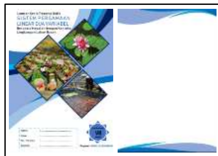
Gambar 1 Cover dan Halaman LKPD

Aplikasi perangkat lunak yang digunakan pada rancangan LKPD ini adalah Microsoft word. Hasil pada tahap ini yaitu sampul depan atau cover beserta desain masing-masing halaman. LKPD didesain memanfaatkan berbagai font style diantaranya Bahnschrift SemiBold, SemiCondens, Calibri, Times New Roman dan Forte guna menambah keindahan LKPD serta menggunakan A4 untuk ukuran kertasnya. Desain sampul depan LKPD dan halaman terdapat pada Gambar 1 berikut.