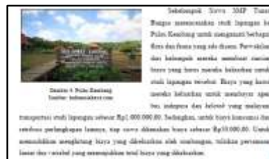
Gambar 9 Wisata Susur Sungai

Konteks wisata susur sungai pada LKPD yang dikembangkan terdapat pada Gambar 9 berikut.