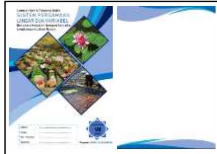
Gambar 2 Cover dan Halaman LKPD

Desain sampul depan LKPD dan halaman terdapat pada Gambar 2 berikut.