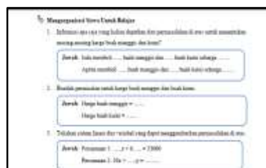
Gambar 4 Mengorganisasikan Peserta Didik Untuk Belajar

Langkah Mengorganisasikan Peserta Didik Untuk Belajar pada LKPD yang dikembangkan terdapat pada Gambar 4 berikut.