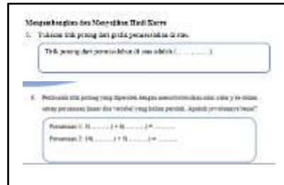
Gambar 6 Mengembangkan dan Menyajikan Hasil Karya

Langkah Mengembangkan dan Menyajikan Hasil Karya pada LKPD yang dikembangkan terdapat pada Gambar 6 berikut.