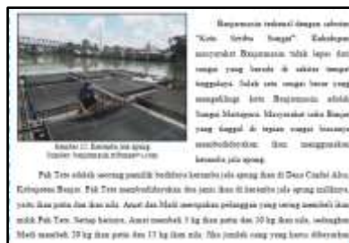
Gambar 10 Budidaya Tambak Ikan

Konteks budidaya tambak ikan pada LKPD yang dikembangkan terdapat pada Gambar 10 berikut.