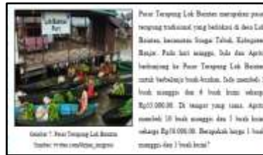
Gambar 8 Pasar Terapung