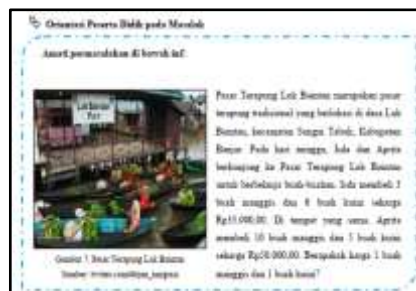
Gambar 3 Orientasi Peserta Didik

Langkah orientasi peserta didik pada LKPD yang dikembangkan terdapat pada Gambar 3 berikut.