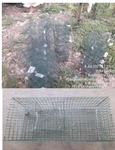
Gambar 1. Perangkap Semi Otomatis Proses Pembuatan Umpan