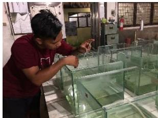
Gambar 4. Pemberian makan

Air yang digunakan dalam penelitian ini air sumur yang berada di laboratorium basah Fakultas perikanan dan kelautan ulm. Pengelolaan kualitas air dengan 1 hari sekali penyiponan dan penambahan air, penambahan oksigen dibantu menggunakan blower resun lp-60 untuk meningkatkan oksigen terlarut (lihat Gambar 4).