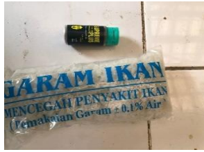
Gambar (2). Media Artemia sp.