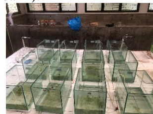
Gambar 1. Wadah penelitian

Media pemeliharaan pada penelitian ini menggunakan akuarium diameter 40x30x30 cm di isi air dengan ketinggian air 15 cm menghasilkan volume 20 liter dan diberi aerasi (lihat Gambar 1).