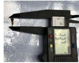
Gambar 5. Pengukuran Ikan

menggunakan jangka sorong digital dan timbangan digital (lihat gambar 5).