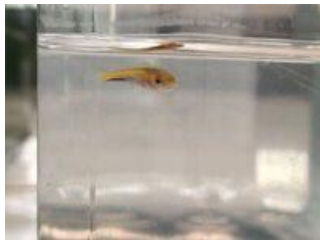
Gambar 3. Ikan Uji

Larva uji yang digunakan untuk penelitian ini yaitu larva ikan gabus haruan berukuran \pm 1 cm yang dipelihara dalam akuarium dengan padat tebar satu buah akuarium menampung sebanyak 24 ekor (lihat Gambar 3).